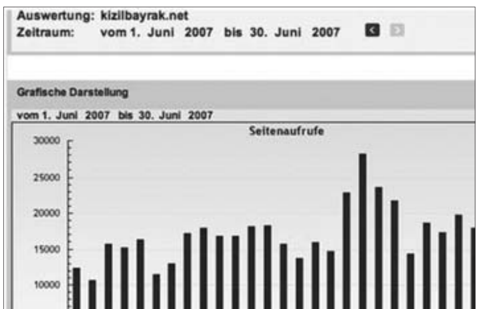
Haziran (2007) ayı günlük bakılan sayfa tablosu (Rakam olarak):